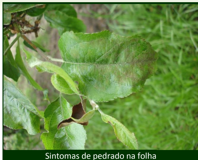
Sintomas de pedrado na folha

Consulte aqui a lista de fungicidas anti-pedrado anexa à circular nº3/2018.