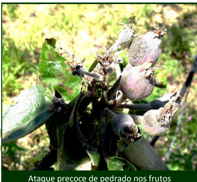
Ataque precoce de pedrado nos frutos