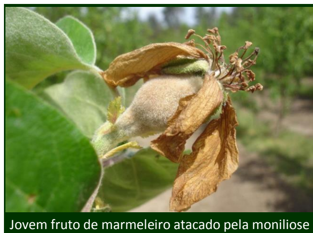
Jovem fruto de marmeleiro atacado pela moniliose