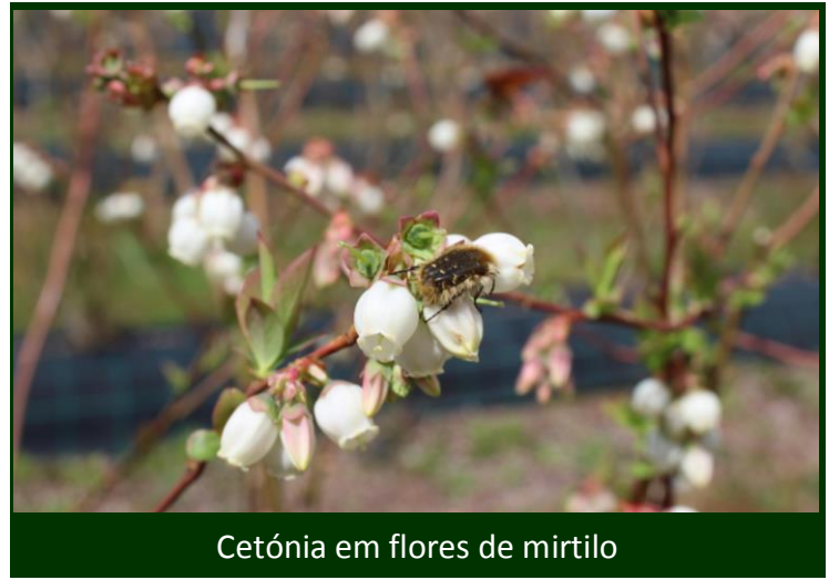
Cetónia em flores de mirtilo

As cetónias alimentam-se dos estames das flores de variadas plantas, espontâneas e cultivadas. Por outro lado, ao deslocarem-se sobre as flores, atuam como polinizadores eficazes de inúmeras plantas.