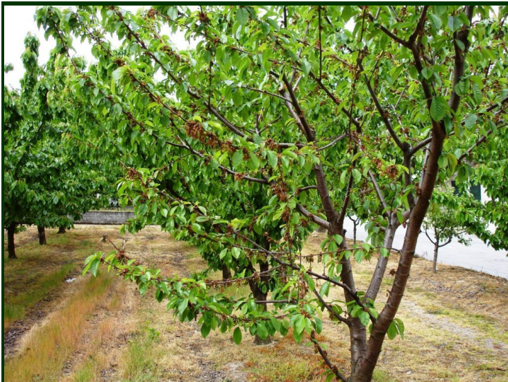
Produção totalmente destruída por ataque de moniliose na floração

(AMEIXEIRAS, CEREJEIRAS, DAMASQUEIROS E PESSEGUEIROS)