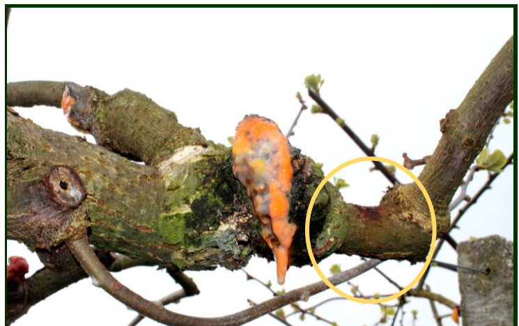
Exsudação de seiva com bactérias da PSA e lesão (cancro) (dentro do círculo)

Para combate à PSA no Modo de Produção Biológico , são autorizados produtos à base de cobre .